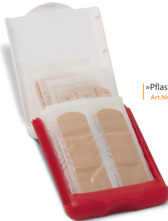
»Pflaster-Set« Art.Nr. 1671