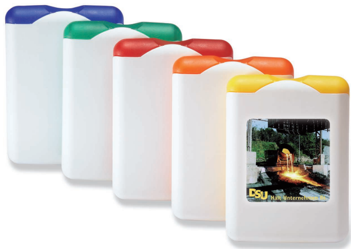
»First-Aid« Art.Nr. 1651