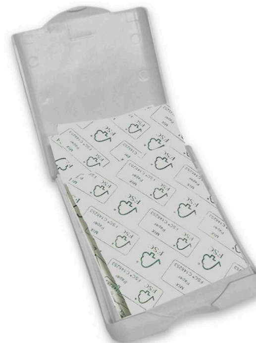
»ECO« Art.Nr. 1681