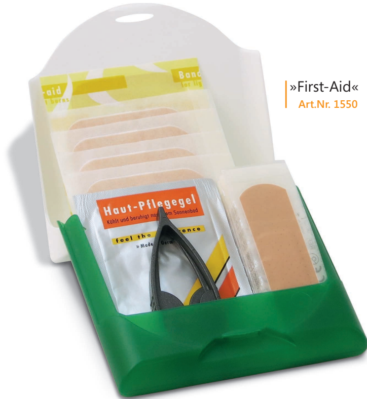
»First-Aid« Art.Nr. 1550