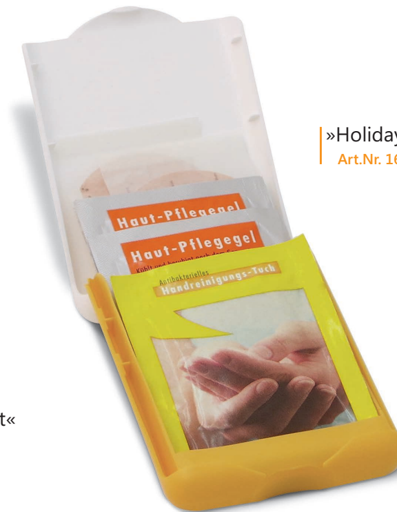
»Holiday« Art.Nr. 1661