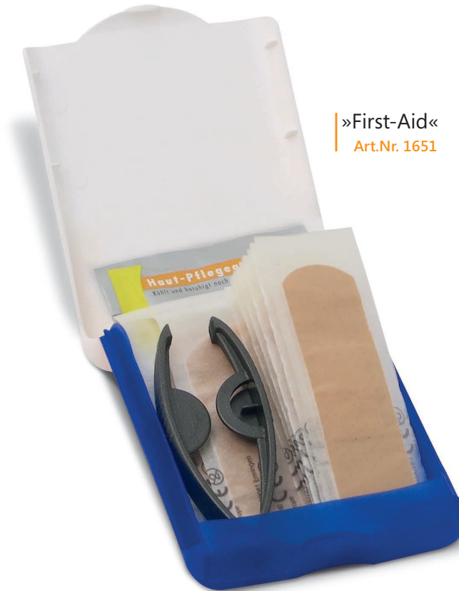
»First-Aid« Art.Nr. 1651