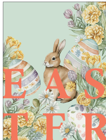
219169 Retro Easter Green