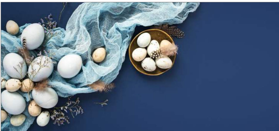
219165 Edle Ostereier