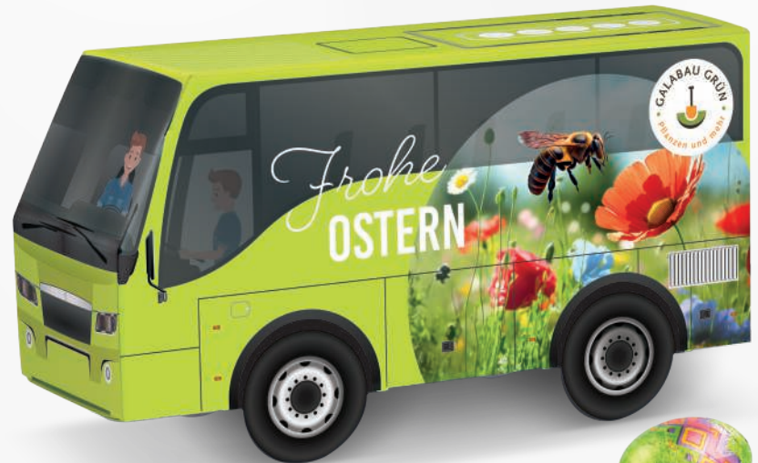
ART.-NR.: 1297 BUS PRÄSENT