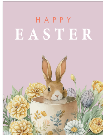
219168 Retro Easter Pink