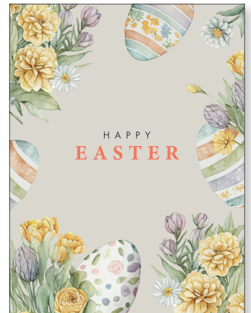
219170 Retro Easter Grey