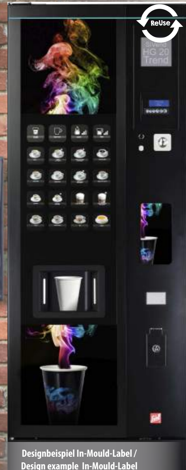
Designbeispiel In-Mould-Label / Design example In-Mould-Label