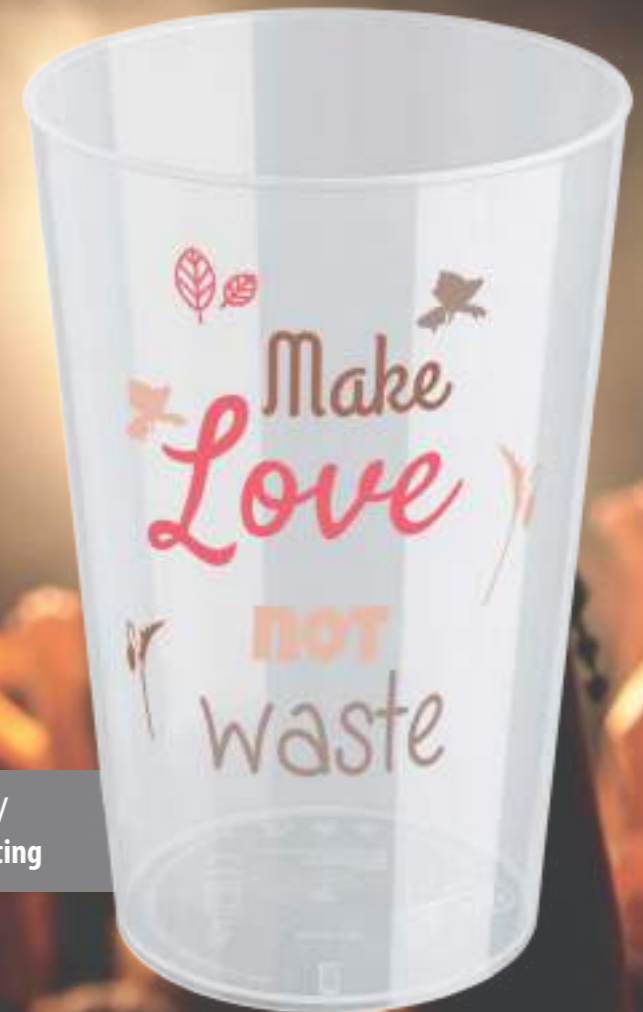
Designbeispiel Siebdruck / Design example Screen-Printing