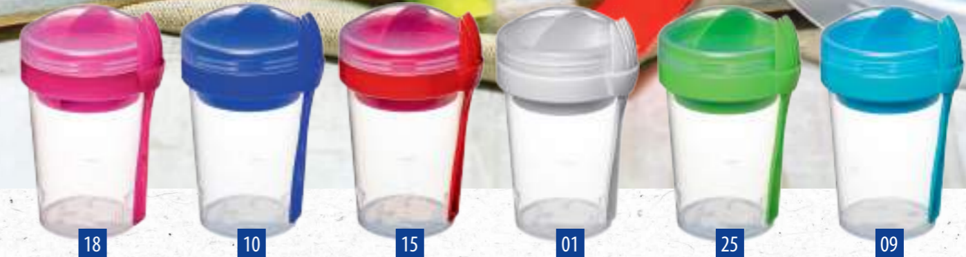
Container mit 2 Fächern (2 x 65 ml) / Container with 2 compartments (2 x 65 ml) Basic-Becher (500 ml) / Basic-cup (500 ml)