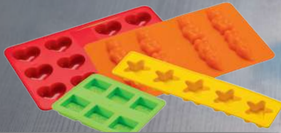
Eiswürfelformen in Ihrem Wunschdesign auf Anfrage möglich / Ice trays in special shape on request