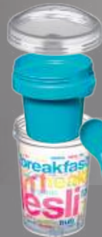
FrISChe-Container, 250 ml / „Fresh-Effect“ container, 250 ml Basic-Becher, 500 ml / Basic-cup, 500 ml