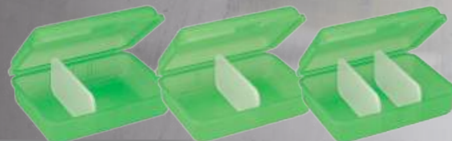
Mögliche Variationen der Trennplatten / Possible variations of the separation plates