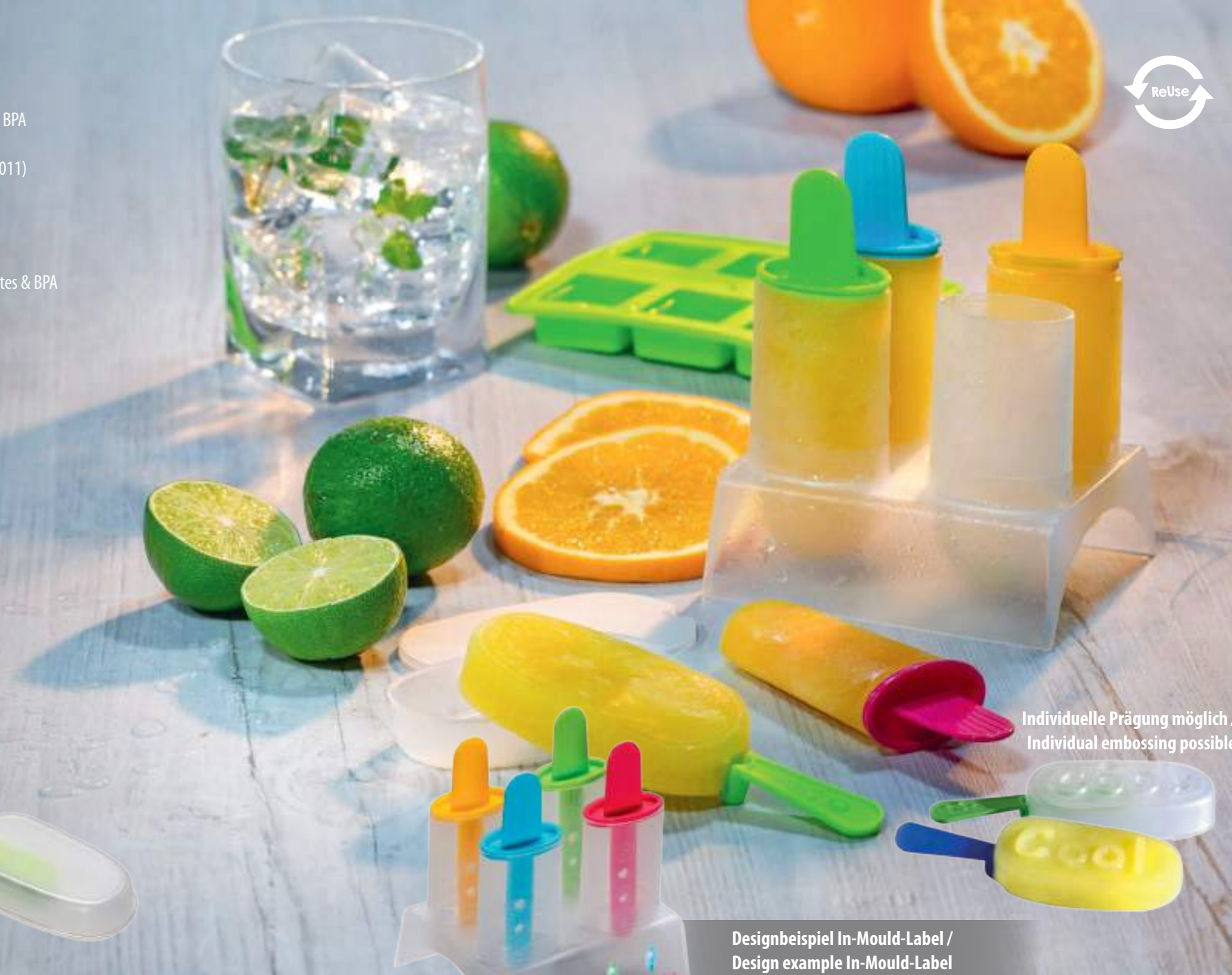
Individuelle Prägung möglich / Individual embossing possible