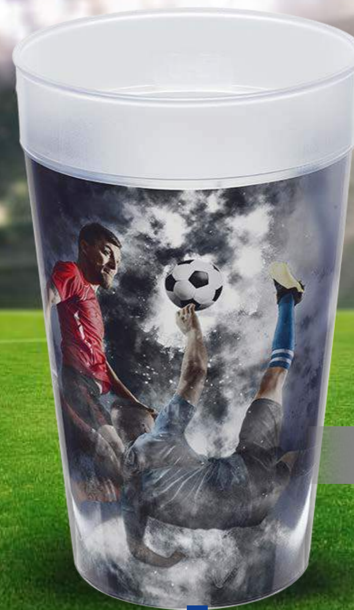
Designbeispiele In-Mould-Label / Design examples In-Mould-Label