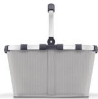
BK 7074 carrybag VE/UNIT 4/12