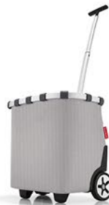
OE 7074 carrycruiser VE/UNIT 1/1