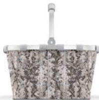
BK 1040 carrybag VE/UNIT 4/12