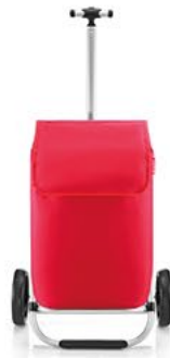
MH 3004 red