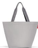
ZS 7074 shopper M VE/UNIT 6/24