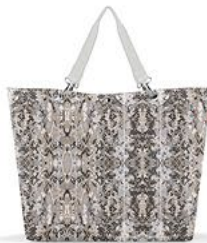
ZU 1040 shopper XL VE/UNIT 6/12