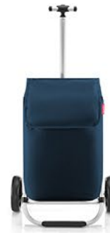
MH 4059 dark blue