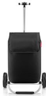
MH 7003 black