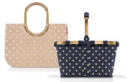
METALLIC DOTS COFFEE/BLUE