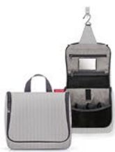
WH 7074 toiletbag VE/UNIT 6/36