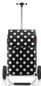
MH 7073 dots white