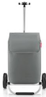
MH 1025 grey