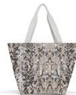
ZS 1040 shopper M VE/UNIT 6/24