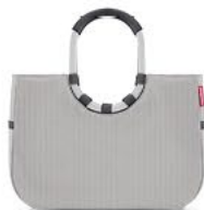
OR 7074 loopshopper L VE/UNIT 4/12