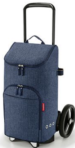
CITYCRUISER RACK & BAG