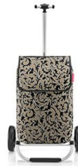
MH 7061 baroque marble