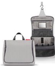
WO 7074 toiletbag XL VE/UNIT 6/24