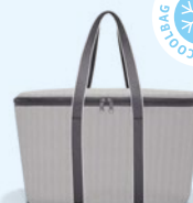
UH 7074 coolerbag VE/UNIT 4/12