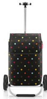
MH 7009 dots